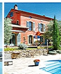
Fayence Belle propriété de grand standing