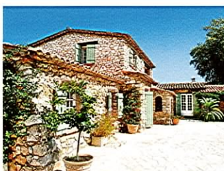
Biot Une authentique maison de pays