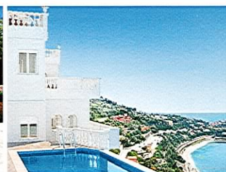
Villefranche-sur-Mer Propriété avec vue mer panoramique