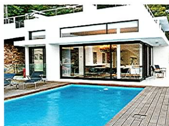
Mandelieu Belle propriété contemporaine