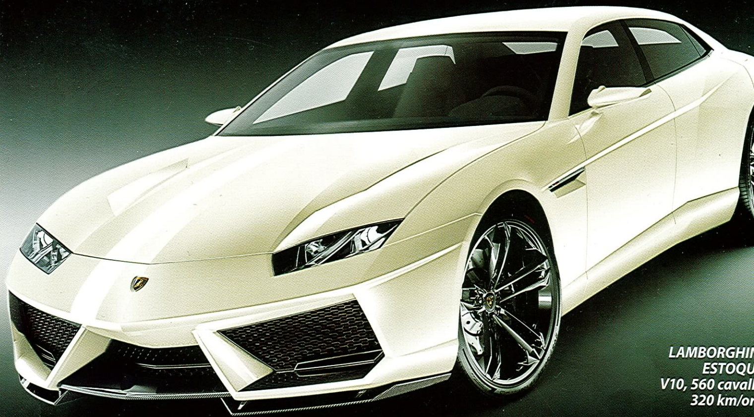
LAMBORGHINI ESTOQUE V10, 560 cavalli 320 km/ora

MENSILE | ANNO 3 | N. 33 NOVEMBRE 2008 | € 3,90